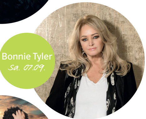
Bonnie Tyler Sa. 07.09.